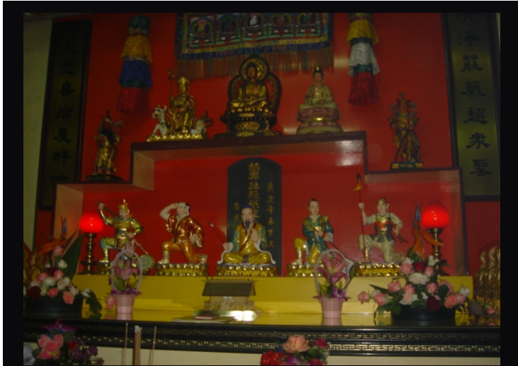
圖示1：原來在台灣天母陰廟的「墓碑」