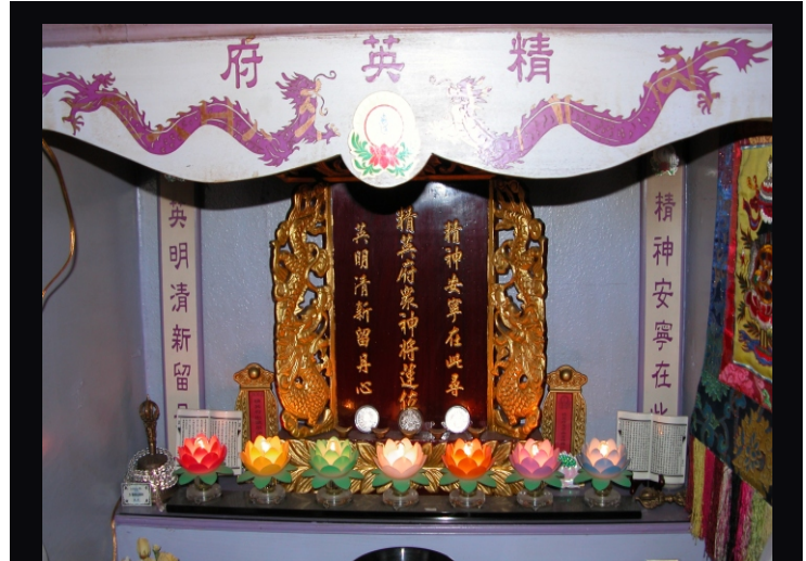
圖示2：供奉在美國紫蓮堂的精英府及3830精英僧眾神位